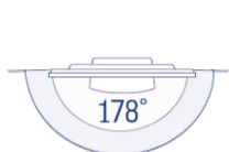
Weitwinkeldisplays von höchster Qualität